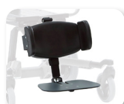
Reposapiés en plataforma