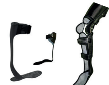
KAFO Y AFO