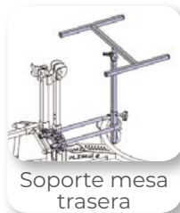
Soporte mesa trasera