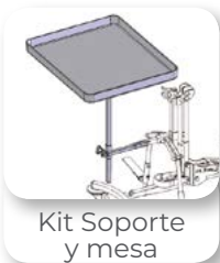
Kit Soporte y mesa