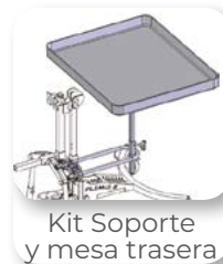
Kit Soporte y mesa trasera