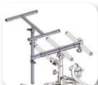
Soporte de mesa