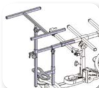
Soporte de mesa y reposapiés