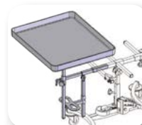
Kit soporte con mesa y reposapiés