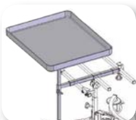
Kit soporte y mesa