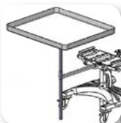
Kit soporte y mesa