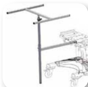
Soporte de mesa